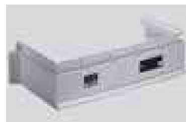
Nadstawka doświetlacza (z regulacją wysokości od 9 cm do 30 cm), z zestawem montażowym

1) Na doświetlaczach przejezdnych dla samochodów osobowych nie stosować nadstawek