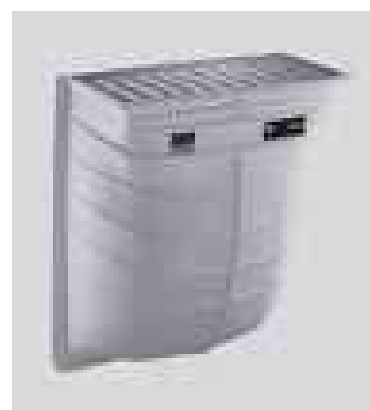
Doświetlacz z rusztem oczkowym, zabezpieczeniem przed wyjęciem i zestawem montażowym