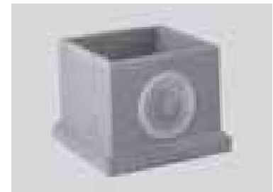
Nadstawka z polimerbetonu do podwyższenia wpustu podwórzowego, z uformowanym wyżłobieniem Ø 110 do podłączenia wpustu dachowego