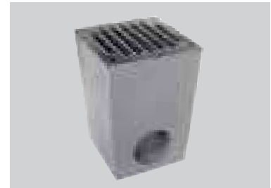
Wpust podwórzowy z polimerbetonu, z rusztem ze stali ocynkowanej, koszem osadczym z PP, odpływem Ø 110 i wymiowanym zasyfonowaniem